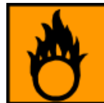
O - Comburant

F ixemos a sacha do millo branco o pasado 7 de xuño, domingo.